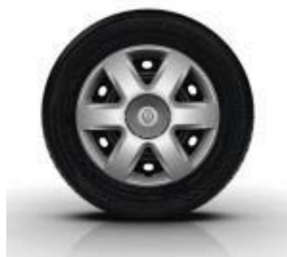
Enjoliveur 15" BRIGANTIN de série sur Kangoo et Grand Kangoo Life