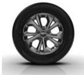
Jantes Alliage ARIA 15" Dark Métal de série sur Extrem