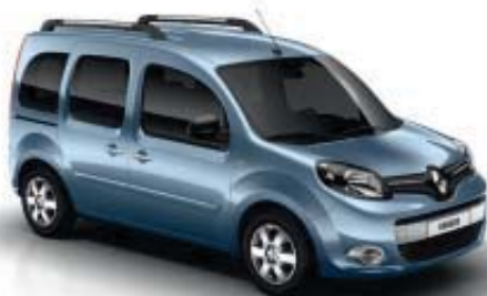
BLEU ÉTOILE (TE)