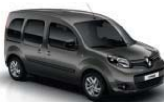
Kangoo ZEN avec option jantes Alliage Egeus 16"

R-Plug&Radio avec Bluetooth® et Plug&Music (port USB et prise Jack) avec satellite de commandes au volant et afficheur intégré Rack de rangement au-dessus des places avant Régulateur et limiteur de vitesse Rétroviseurs extérieurs réglables électriquement et dégivrants avec sonde de température Sellerie Celcius Siège conducteur réglable en hauteur Tablette cache-bagages multipositions, escamotable derrière la banquette arrière Tapis de l'habitacle et du coffre en moquette