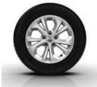
Jantes Alliage ARIA 15" en option sur Kangoo Zen et Intens et Grand Kangoo Intens