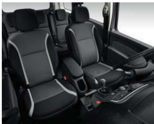
Sellerie CELCIUS de série à partir de Zen sur Kangoo de série sur Grand Kangoo