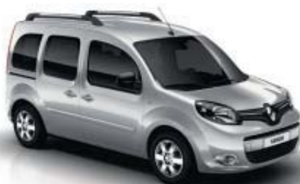
GRIS ARGENT (TE)