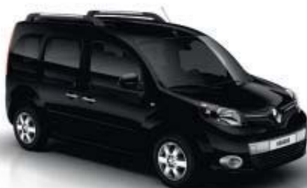
NOIR MÉTAL (TE)