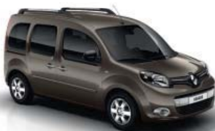
BRUN MOKA (TE)

OV : opaque verni ; TE : peinture métallisée Photos non contractuelles. Les teintes Gris taupe et Rouge vif sont disponibles sur : - le niveau Zen avec Pack Business - le niveau Life avec les boucliers avant/arrière noir grainé