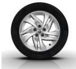
Jantes Alliage EGEUS 16" en option sur Kangoo Zen et Intens