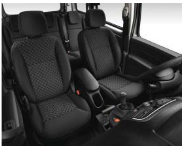
Sellerie TITANE de série sur Kangoo Life