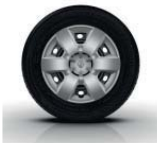
Enjoliveur 15" EGEE de série sur Kangoo Zen et Intens et Grand Kangoo Intens