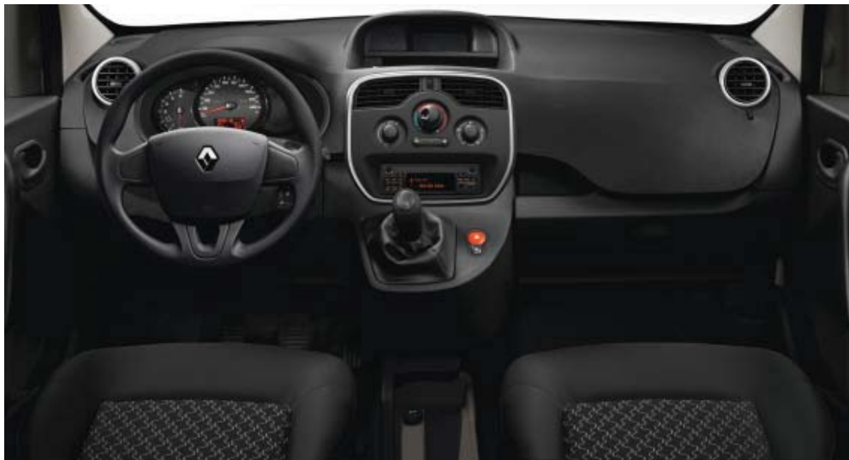
Version Life présentée avec climatisation manuelle et radio disponibles en option. Sellerie Titane (Kangoo).

NIVEAUX D'ÉQUIPEMENT, TEINTES, OPTIONS, À VOUS DE JOUER!